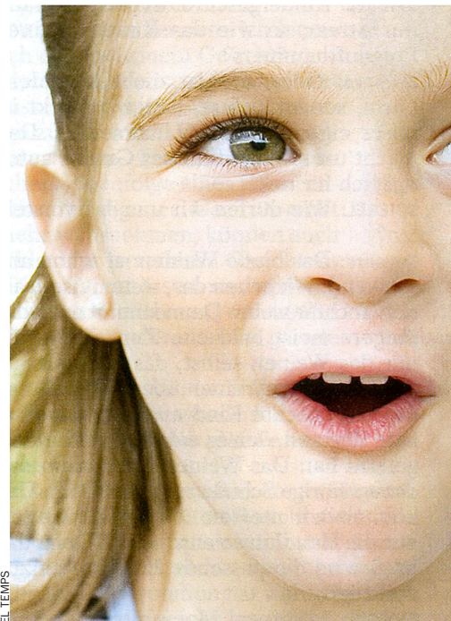
La tristesa, la por, la ira i el fàstic són emocions

ciència està en el sistema mirall: com pot l'home imaginar els seus actes i les seues emocions com si es veiera ell mateix? Com pot ser conscient dels seus actes? Per a Prinz, la resposta és davant d'ells: "Nosaltres vam aprendre observant els altres".