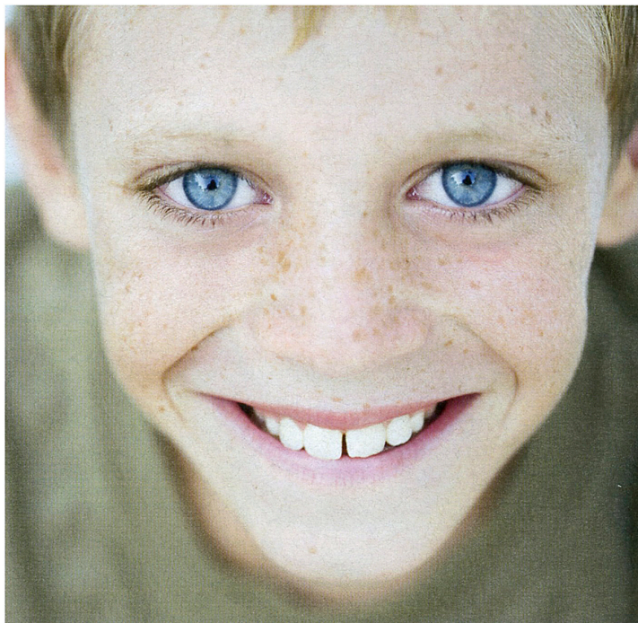
que s'encomanen. Però també se n'encomanen de més complexes com la solitud o la vergonya.

a aplicar aquesta capacitat en la seua vida interior. Ell girava gairebé el mirall, es posava en la seua situació. I ací també sorgien emocions, sentiments i intencions que ell observava com si foren les d'un altre.