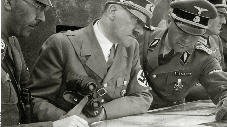
Els britànics van fer córrer la notícia que el metge de Hitler havia viatjat a Suïssa per a buscar un psiquiatre que estudiés les seves pèrdues de memòria i una greu paranoia megalòmana.

inepta que resultés innòcua, el govern alemany no hauria dubtat a exposar-la públicament”.