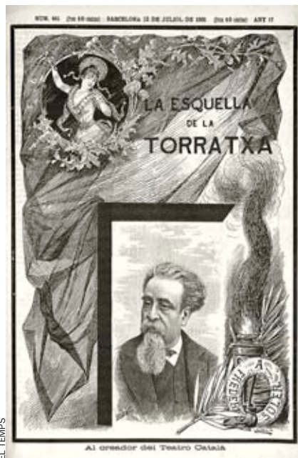
Pitarra a la portada de L'Esquella de la Torratxa. Protagonitzarà la temporada del TNC.

Pel que fa al projecte T6, de descobriment de valors, es crea una bústia