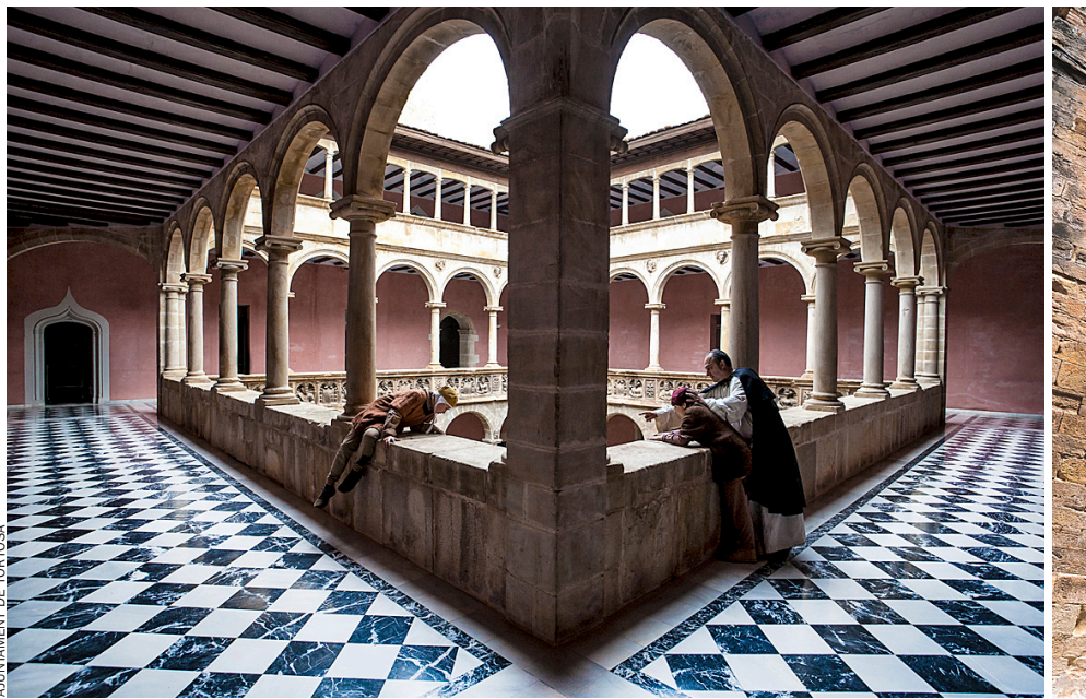
AJUNTAMENT DE TORTOSA

I amb tot, tenint una situació geogràfica privilegiada, un enorme potencial de recursos naturals i, a més, ser un enclavament administratiu i econòmic de primer ordre, la ciutat no acabava d'enlairar-se. En paraules de Despuig: “no obstant que és la tercera població de Catalunya en