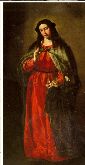
ROCCO RICCI / VIENA EDICIONS