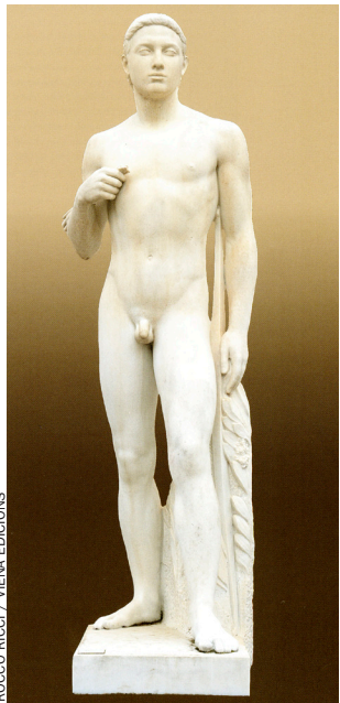
ROCCO RICCI / VIENA EDICIONS