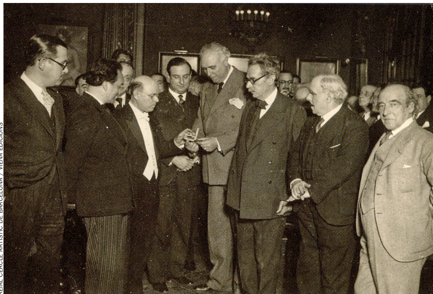
REAL CERCLE ARTÍSTIC DE BARCELONA / VIENA EDICIONS

Independència de criteri. Francesc Fontbona constata que, si bé Casals es deixava aconsellar per alguns dels galeristes més importants de l'època,