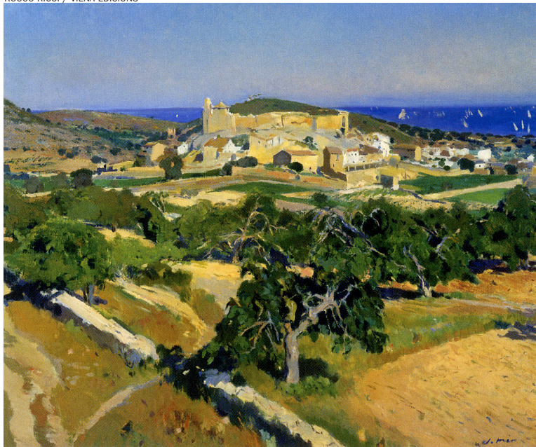
ROCCO RICCI / VIENA EDICIONS