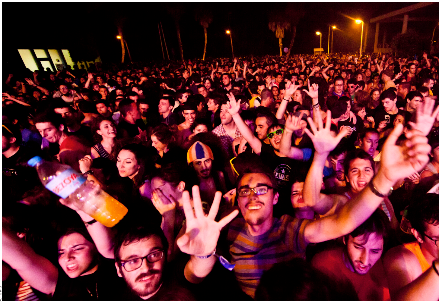
El 23 de juny, 7.000 persones es donaren cita a la platja de la Patacona amb motiu del Xufa Rock.