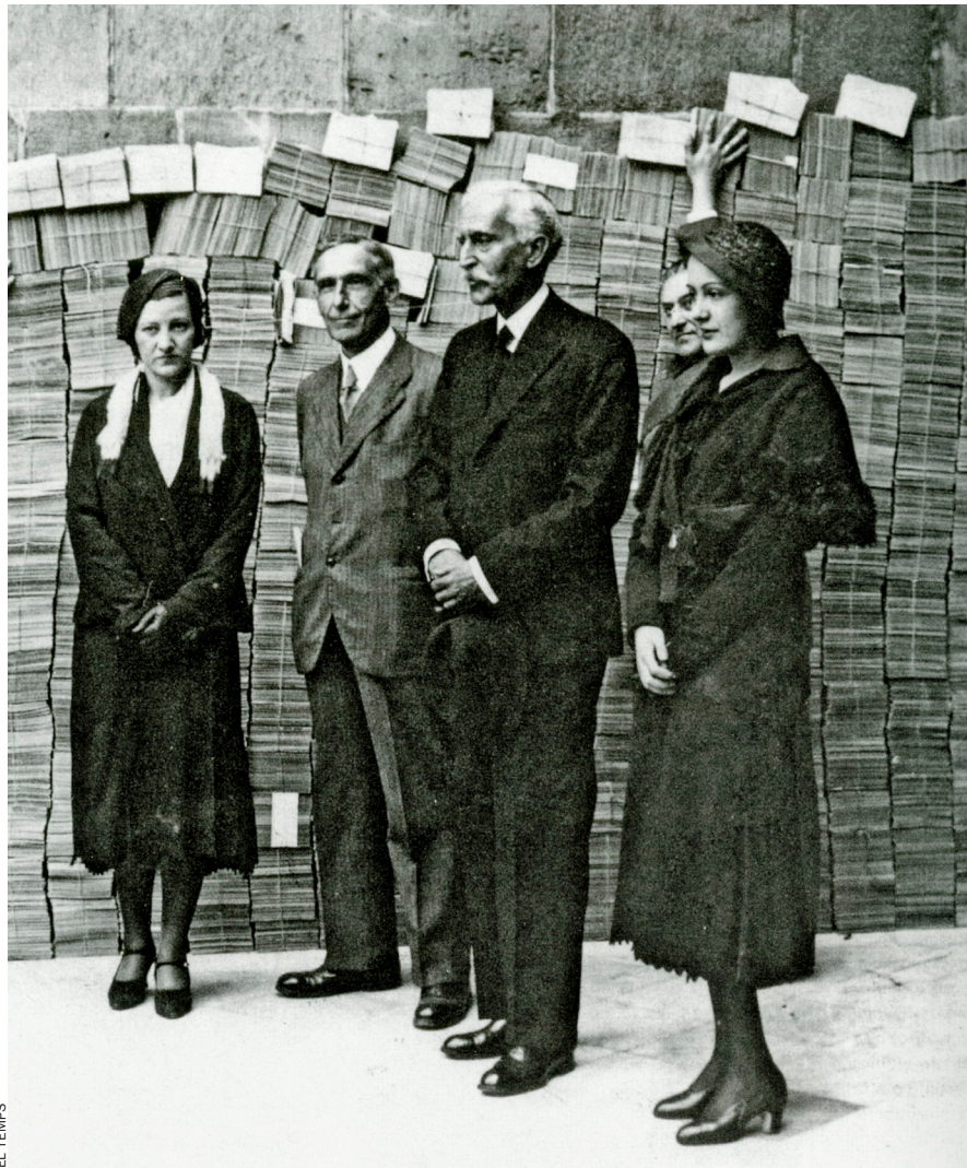
Fabra, a l'acte de lliurament al president Macià de les signatures a favor de l'Estatut, el 1932.

No serà pas un títol honorífic, perquè el veurem presidint diversos actes