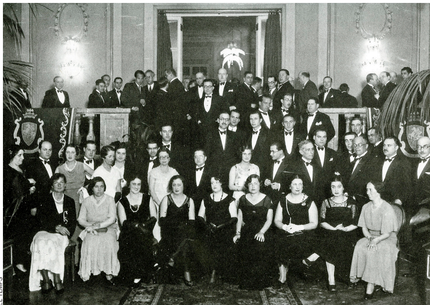
Sopar d'homenatge a Carles Riba al Ritz de Barcelona, el 9 d'abril de 1932, amb assistència, entre altres, de Fabra, Estelrich i Sagarra. Visita a València de Fabra, amb Aramon, Coromines i Casacuberta, el 24 de novembre de 1935. Van ser rebuts per Acció Nacionalista Valenciana.