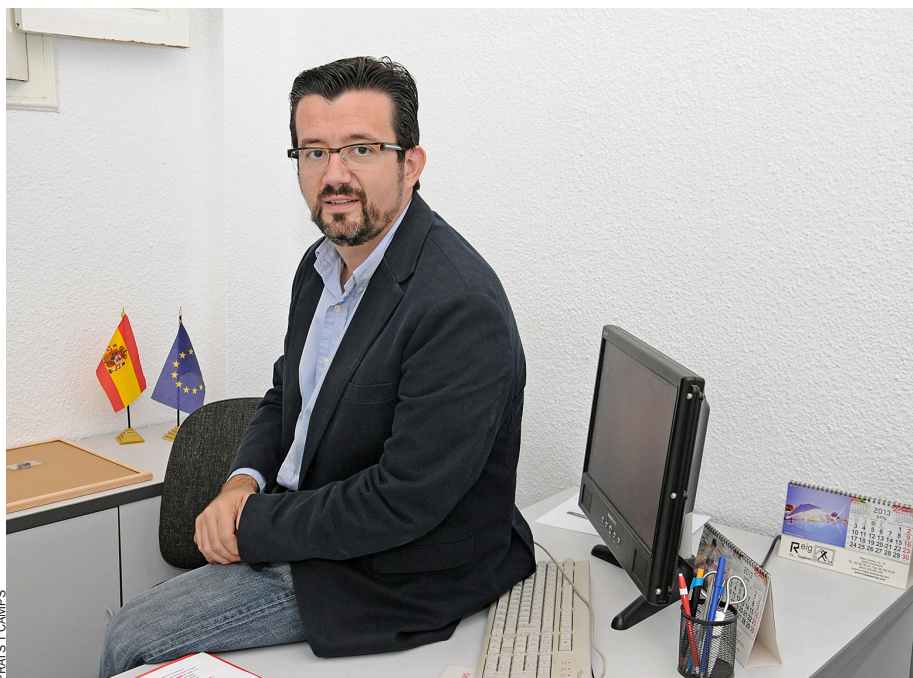
PRATS I CAMPS