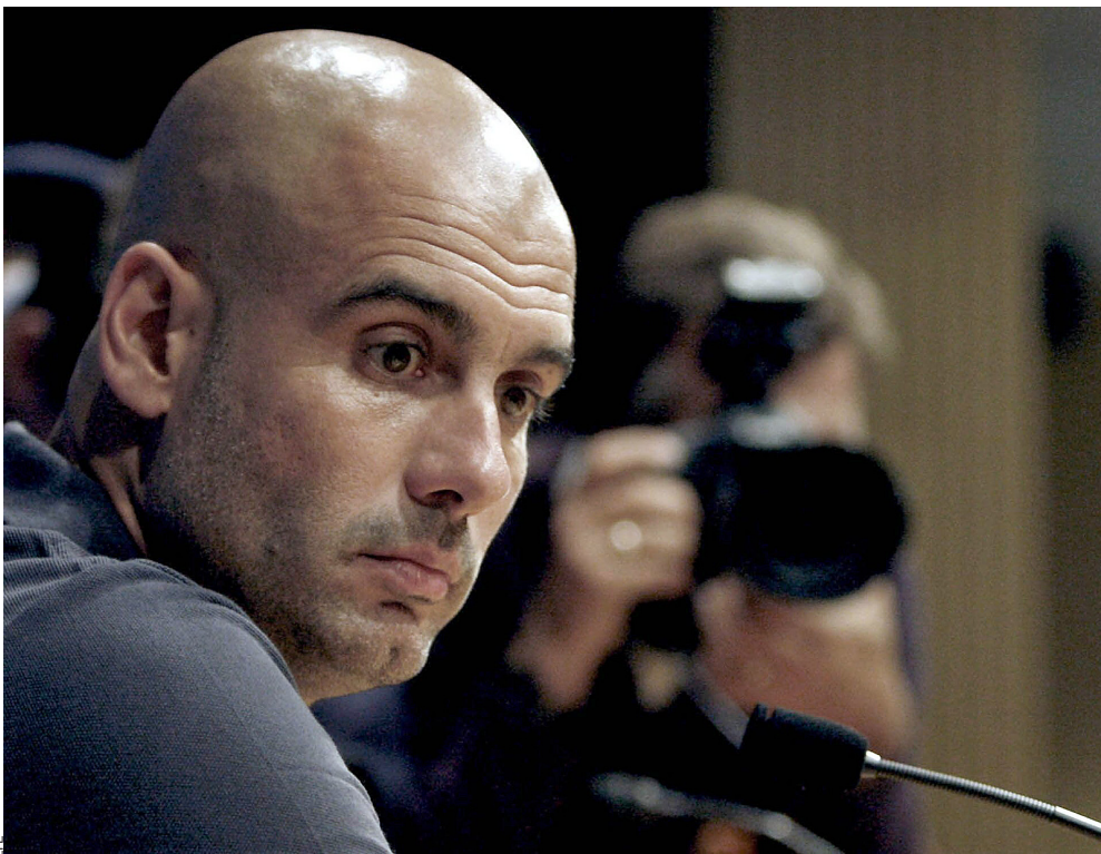
Guardiola vol parlar alemany des del primer dia. A la dreta, Messi i Ribery en l'últim enfrontament

La reflexió darrere d'aquest joc de cartes amanit és: si Guardiola, al reumat, rebutjara l'oferta, Heynckes es veuria danyat com a segona opció. A més, encara queden partits difícils fins que acabe la temporada: Dortmund, València, i la classificació per a vuitens