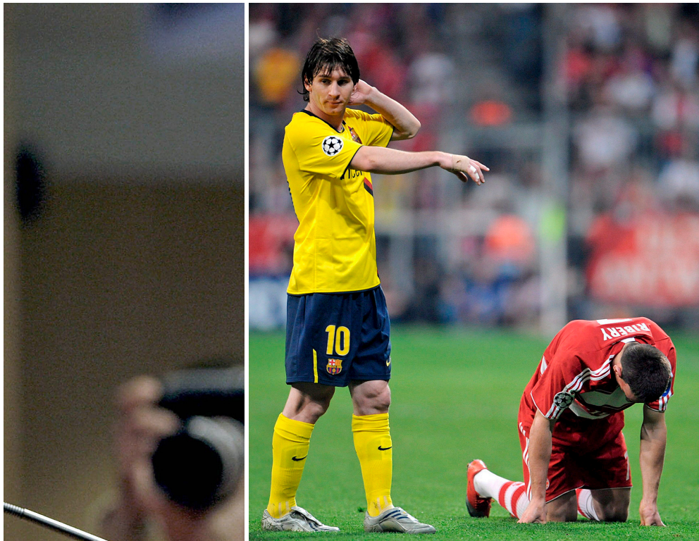
entre Barça i Bayern de Munic en Lliga de Campions, a l'Allianz Arena, el 14 d'abril de 2009.