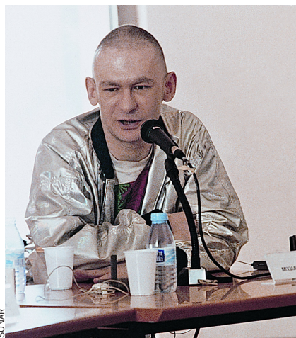
A l'esquerra, compareixença de Mixmaster Morris en la presentació del Sónar de 1994. A la dreta, Richie Hawtin, un assidu del Sónar des de 1996.