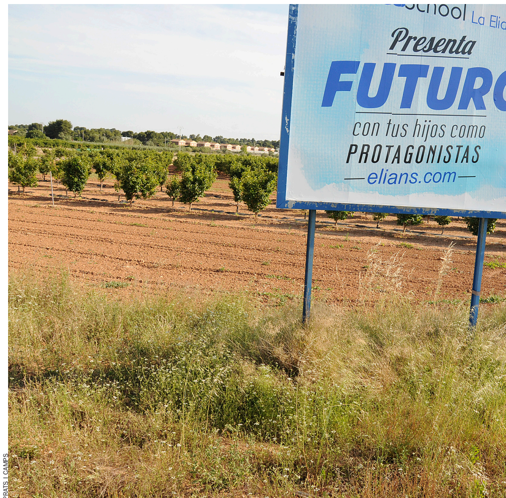
Una tanca publicitària a la Pobla de Vallbona enmig de dos camps, l'un conreat, l'altre abandonat.

Q ue el sector agrari ja no és el que era és una afirmació que qualsevol mortal subscriuria. La modernització de l'economia ha drenat activitat i ocupació des del sector primari cap als sectors industrial i, sobretot, de serveis, com ha passat a la resta de països desenvolupats. Les xifres ajuden a capir el canvi en tota la seua magnitud. Segons dades de la Unió de L'auradors i Ramaders, entre 1983 i 2009, l'agricultura va passar de representar el 6% del PIB valencià a sols el 2,1%. En aquest mateix període, la població ocupada en el sector va disminuir en 86.000 persones, cosa que significa un 57% menys. El gruix de l'agricultura valenciana va entrar al nou mil·lenni en un ambient de