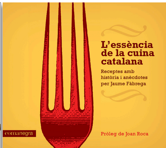
Dos llibres de cuina tradicional poc estudiada, la dels mariners i la dels monjos, i un cànon de la cuina catalana, amb anècdotes incloses.

tronomia de l'Escola Universitària de Turisme i Direcció Hotelera de la Universitat Autònoma de Barcelona. I no solament la seva història. També hi són tractats els aspectes lingüístics i, com sempre és preceptiu en els llibres de l'autor, cada recepta és situada en el seu context i comparada amb d'altres d'arreu del món, en un apassionant viatge a través dels noms, l'antropologia, l'evolució dels plats, les seves fonts bibliogràfiques... I encara més! Cada recepta –perfectament explicada pas a pas, a fi que tothom les pugui fer–, en les seves antològiques introduccions, és també documentada en la literatura, el cinema, la música i la cançó, les anècdotes... Així, podem saber quina és la història de l'autèntic arròs negre, qui n'ha parlat, qui n'ha fet teatre o música..., i així amb totes i cadascuna de les receptes. I fins i tot quins altres tipus d'arrossos negres hi pot haver al món!