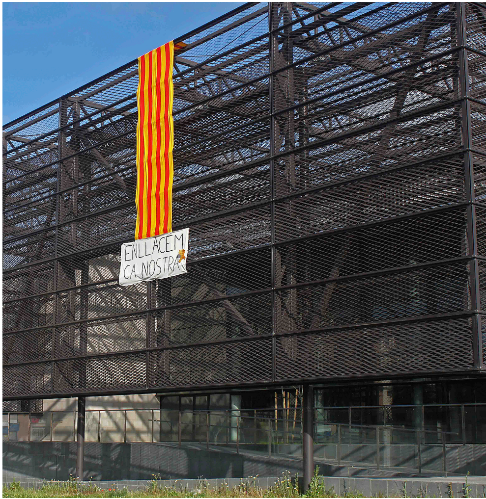
política lingüística del govern de Bauzà.

reunir la setmana passada per analitzar quina havia de ser la resposta al tancament absolut de la conselleria a negociar la implantació del decret. Es mostraren contraris a convocar una vaga per a aquest curs, que ja està finalitzant, sinó que s'estimen més ajornar qualsevol mobilització d'aquesta mena per al començament del proper curs, al setembre.