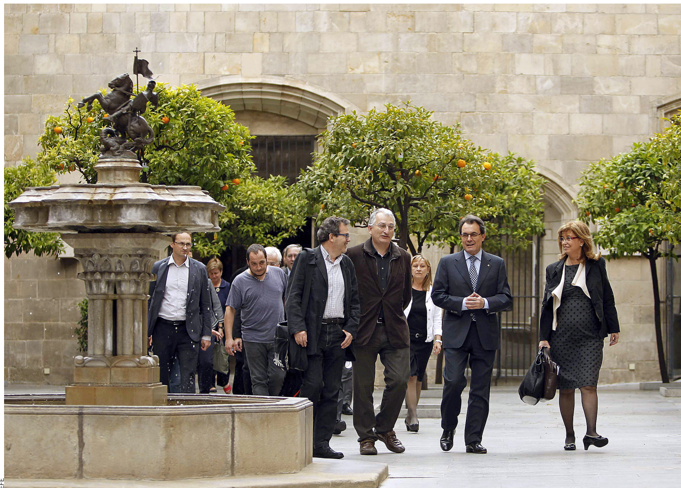
Representants del Consell Escolar de Catalunya amb el president Mas i la consellera Rigau i representants polítics, a l'entrada de la cimera.

L a setena reforma de l'ensenyament de la recent història espanyola, la LOMCE (Llei d'Ordinació de la Millora de la Qualitat de l'Educació), és la que més oposició està trobant i podria acabar tan malament com la LOCE (Llei Orgànica de la Qualitat de l'Educació) de Pilar del Castillo, que no es va arribar a aplicar —va ser anul·lada pel posterior govern de Rodríguez Zapatero.