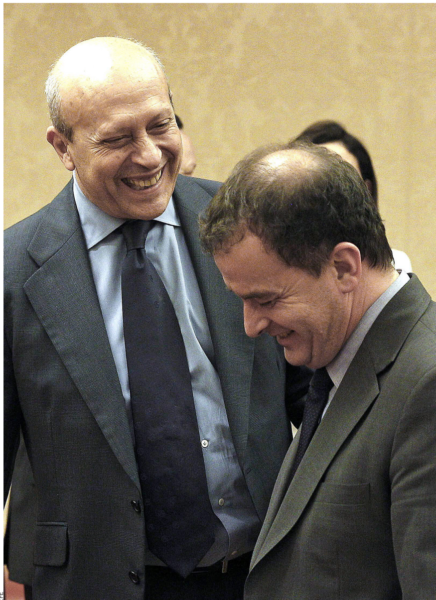
El ministre d'Educació, José Ignacio Wert, fa broma amb el portaveu d'Esquerra Republicana al Congrés dels Diputats, Alfred Bosch.