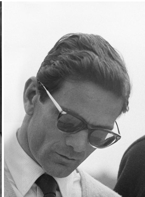
Bertolucci, Godard i Pasolini, el 1969. Preparen la pel·lícula Amore e rabbia . Pasolini i Orson Welles durant el rodatge de La ricotta , l'any 1962, episodi

“Pasolini Roma” és un projecte seleccionat, avaluat i finançat per la Comissió Europea per significar el caràcter europeu, transnacional i actual de l’obra de Pasolini i del projecte en si mateix.