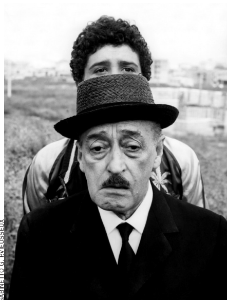
GABINETTO G. RIVISSELIX