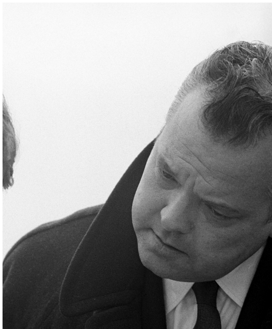
de la pel·lícula Ro.Go.Pa.G.

l'argot dels trinxeraires i les prostitutes de les borgate i el dialecte romà. El llibre provoca un escàndol, però els seus nous amics escriptors el defensen.