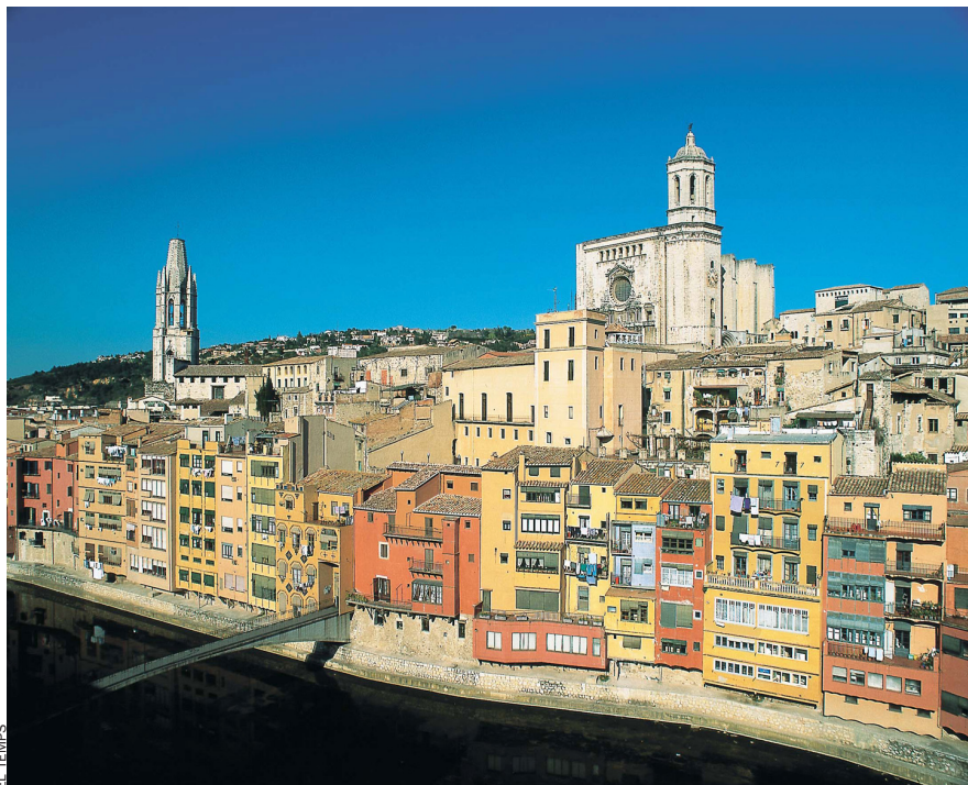
La indústria de l'oci i el turisme, diferenciada del sector serveis, és, a parer dels experts, una altra possible sortida per a l'economia catalana, que proposen d'exportar la marca Catalunya al món.

Garrell també va fer un toc d'atenció a empresaris de pimes i a l'administració catalana. Als primers els va recriminar que persisteixin en "l'estratègia de destruir l'enemic en comptes de cooperar-hi", i va instar les pimes a "abandonar la idea d'empresa vertical i anar a empreses horitzontals, unides". Al govern li va demanar que faci "de catalitzador, perquè la indústria més avançada comenci a fer-se gran".