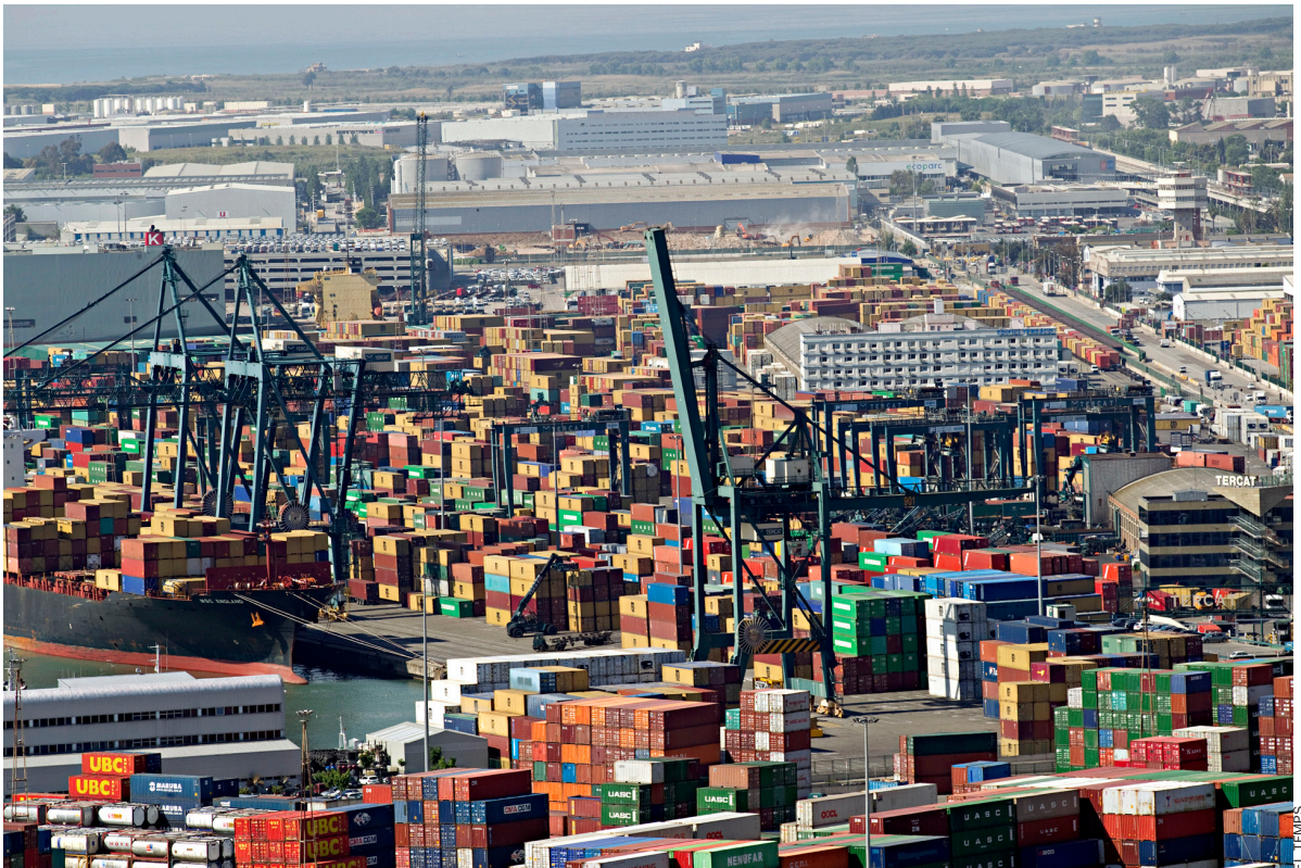
connexió amb l'empresa. Les deficiències en infraestructures de transport són un altre handicap per a la indústria exportadora catalana.

Generalitat, amb una crisi financera greu, no té els mecanismes polítics per a resoldre l'elevada taxa d'atur ni algunes qüestions socials”, però, en canvi, “la indústria sí que pot iniciar una nova revolució per facilitar la sortida d'aquest atzucac, perquè són les empreses les que creen valor i serveis per a la societat”.