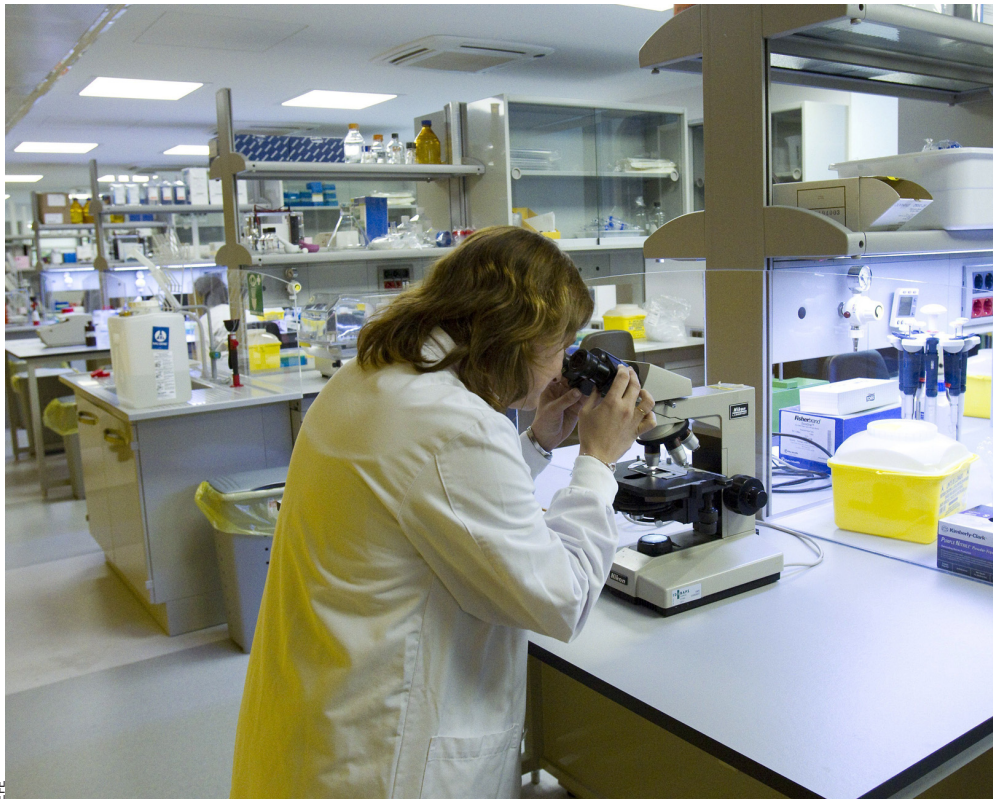
La biomedicina és un dels sectors amb més projecció internacional, però topa amb la manca de

En aquest escenari, diversos experts van dibuixar el full de ruta del sector industrial català per superar la conjuntura actual i per encaixar en un possible escenari d’estat independent. Aquest fou l’objectiu de la jornada “Nous escenaris polítics i econòmics per a la indústria catalana”, organitzada per l’Institut Sallarès i Pla i la Càtedra Josep Termes de Lideratge, Ciutadania i Identitats de la Universitat de Barcelona, amb el suport de la Fundació Gremi de Fabricants de Sabadell. Es partia de la certesa que el gruix de la indústria catalana no fugirà del país tant si esdevé un estat lliure com si continua formant part de l’Estat espanyol, sinó que es transformarà per adaptar-se