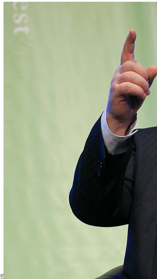
“Tot això que s'ha dit de Raïssa, que va arribar

En aquells moments, la Unió Soviètica era la potència més poderosa del món comunista i, tot i això, algunes de les coses que Gorbaxov descriu es tro-