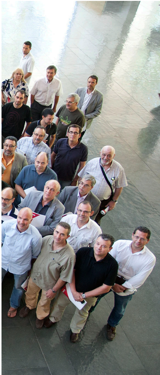
d'Abadal (Vic) i Carles Puigdemont (Girona).

E ls 11 ajuntaments que ara paguen els seus impostos estatals –l’IVA i l’IRPF dels seus treballadors– a l’Agència Tributària de Catalunya seran un centenar abans de l’estiu i uns 700 a finals d’any, segons l’anunci que ha fet l’Associació de Municipis per la Independència, que agrupa avui un total de 699 entitats (663 municipis i 36 mancomunitats més, entre diputacions i consells comarcals). Ara per ara, aquesta acció pot semblar només simbòlica perquè l’Agència Tributària de Catalunya transfereix després aquests