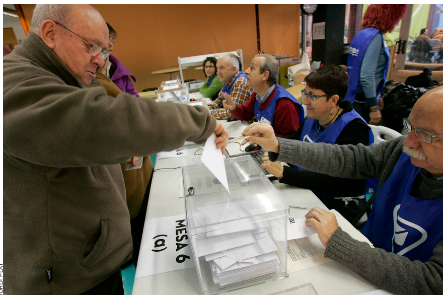
A dalt, una imatge de les consultes sobiranistes, on els municipis van fer un paper clau. A sota, mapa del percentatge de població que agrupen els municipis adherits a l'AMI, per comarques.