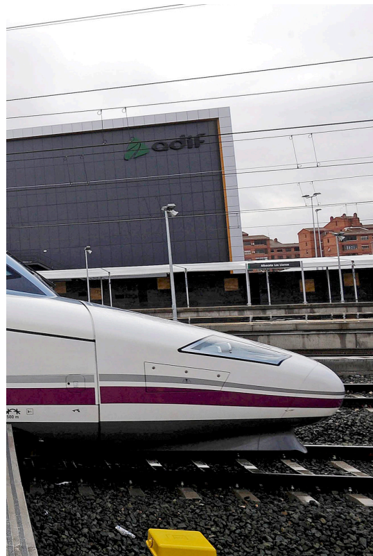
Barcelona-Madrid, no és rendible per a RENFE.

Ciudad Real), Tardienta-Calatayud (Osca-Saragossa) o Puente Genil-Còrdova (Còrdova) suposen carregar als comptes públics uns 1.800 euros de mitjana per passatger, una subvenció estatal només superada per les pèrdues per passatger en aeroports fantasma com el d'Osca-Pirineus, on un viatger, després de pagar el seu bitllet el 2011, quan hi van operar vols, costava a AE-NA 1.607,92 euros més.