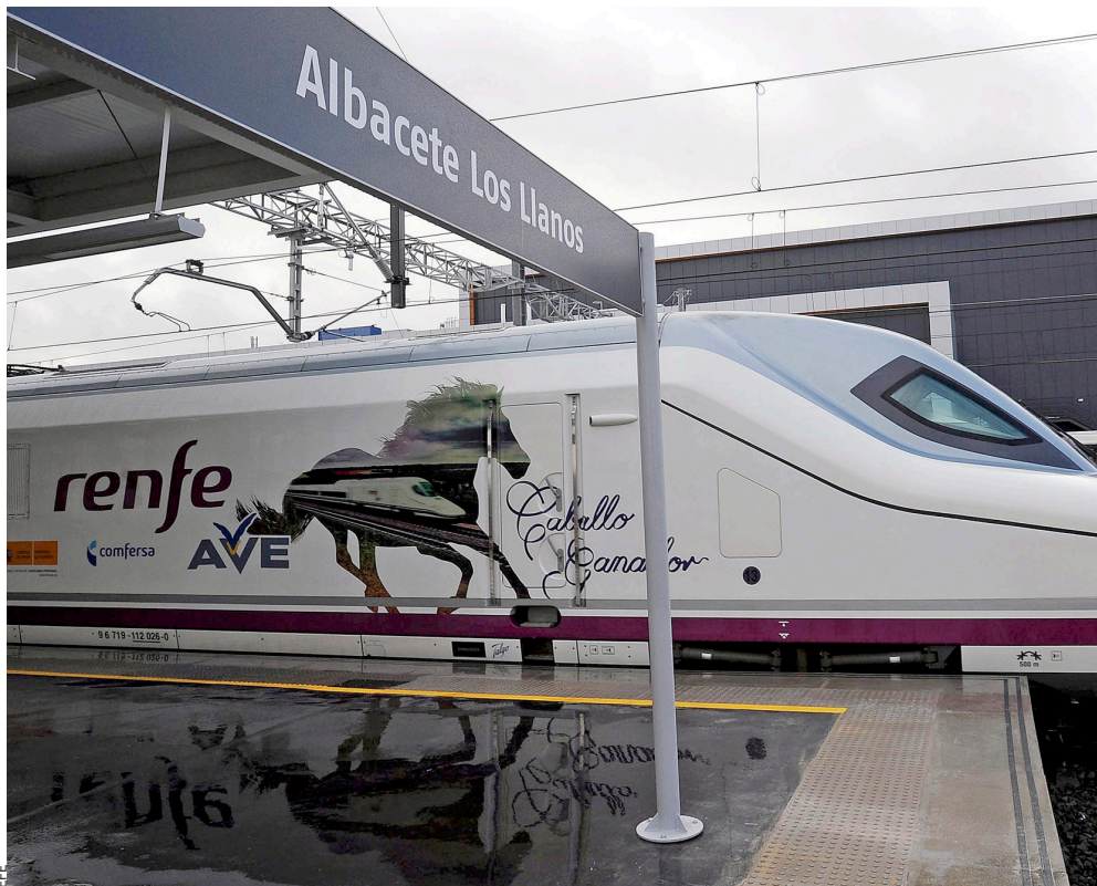
Dels 206 trajectes d'AVE, 48 van transportar un o cap passatger al dia. Cap línia d'AVE, tampoc

L'alta velocitat espanyola continua acumulant rècords d'ineficiència. Sense rutes rendibles, amb Renfe i Adif tràgicament endeutades i 400 milions d'euros de cost de manteniment anual, continua essent l'obsessió de Madrid. Però la liberalització del transport de passatgers posarà en escac Renfe. L'ocellot té els dies comptats.