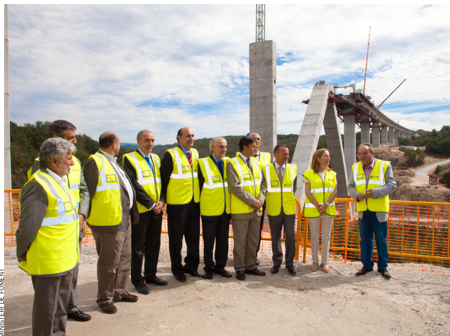
L'AVE a Galícia va ser l'obsessió de José Blanco (PSOE), que va inaugurar el primer tram essent ministre en funcions. El 2012, el PP ha invertit 1.745,3 milions d'euros per al segon tram.

al servei de rodalia i regionals, més utilitzats per persones amb una renda més modesta". Ras i curt, el criteri d'igualtat madrileny acaba essent insolitari i elitista.