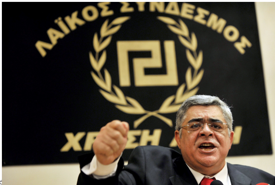
Michaloliakos: “Quan siguem forts, no mostrarem pietat de cap mena. No serà democràtic”. Als carrers d’Atenes els seus partidaris s’encarreguen de demostrar que no eren vanes amenaces.