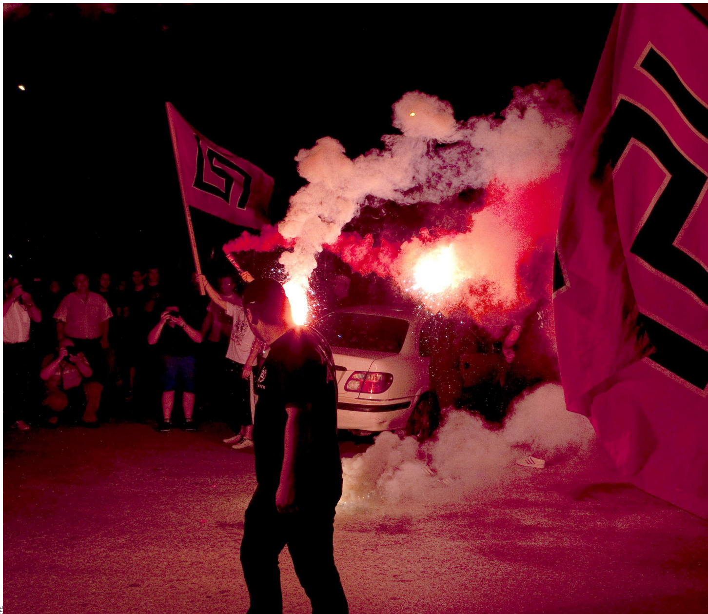
Partidaris d'Alba Daurada. Enlloc més a Europa cap grup d'extrema dreta no està traient tant de profit a la crisi financera com a Grècia.