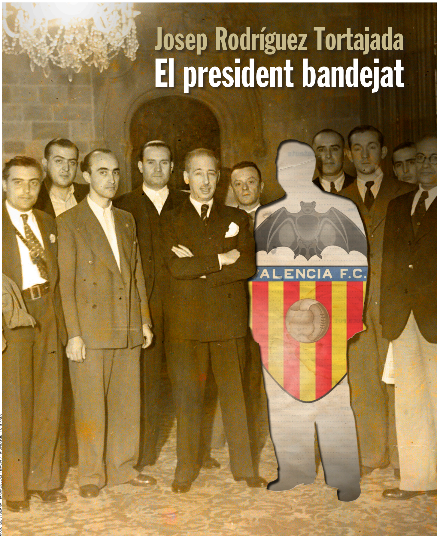
ARXIU MONTSERRAT TARRADELLAS I MACIÀ / MUNTATGE: TONI PAXÀ