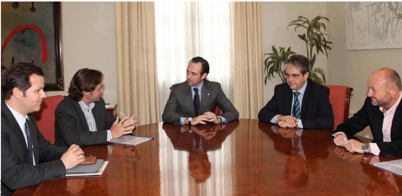
Reunió del president Bauzá (al centre) i el conseller Bosch (a l'esquerra del president) amb els representants del Círculo Balear, amb Jorge Campos (a la dreta de Bauzá) al capdavant.

Més o manco en la mateixa línia s'expressava al cap d'uns dies el secretari general del PP balear, i batlle del poble mallorquí de ses Salines, Miquel Vidal, quan matisava que allò que es farà serà introduir als llibres de text algunes paraules tal com s'usen en les "modalitats