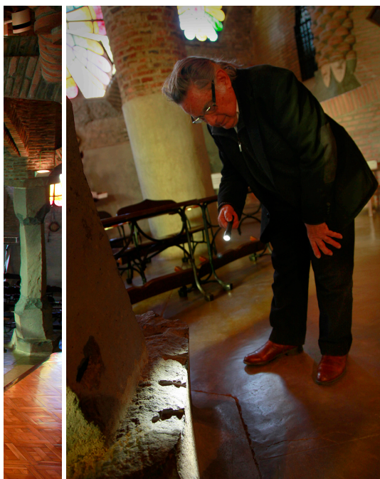
explica un detall constructiu de Gaudí.

—Presenteu Gaudí com un cap molt atípic, que té una relació estreta amb els seus treballadors. Lluny de la supèrbia que inicialment demostrava quan treballava a la Sagrada Família.