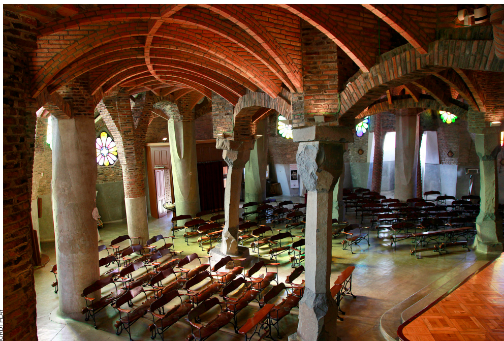
Vista general de l'interior de la cripta, amb els paraboloides hiperbòlics. A l'esquerra, Manuel

— Els documents també destapen un Gaudí empresari que revoluciona