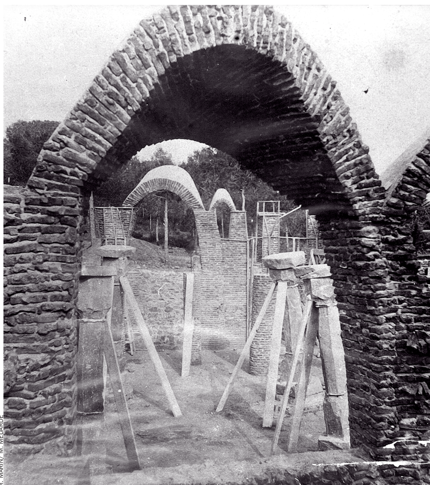
M. MARÍN / M. MEDARDE

Vaig donar-me compte que li va complaure la meua cortesia i per això