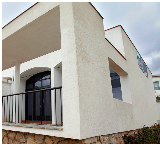
pavelló escolar construït per Josep Lluís Sert.

Dedicatòria del 1952, en l' Obra lírica (1952): “Al meu germà, el metge que lluita contra la Dama”.