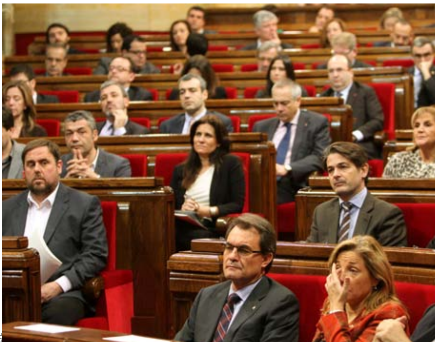
La fragilitat del poder polític i de les finances públiques catalanes obliguen a posar data a la democràcia i a accelerar el procés d'independència.

En la situació actual d'espoli fiscal de 16.000 M€, d'acumulació de 8.000 M€