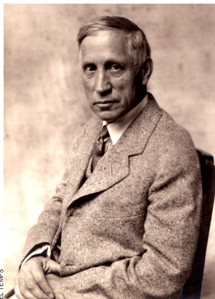
EL TEMPS El georgista utòpic Fiske Warren.

El georgisme considera que la terra és un bé de la humanitat que no pot ser objecte de propietat privada i que, mentre aquest principi no sigui reconegut pels