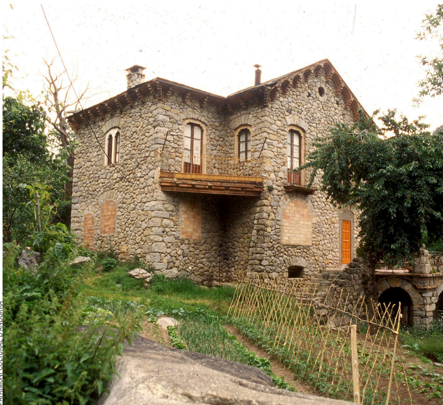
PATRIMONI CULTURAL D'ANDORRA