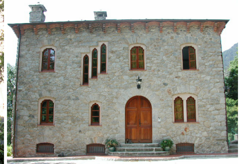
A l'esquerra, la Torre dels Russos abans de la restauració. A la dreta, dues imatges de la Torre dels Russos, avui.