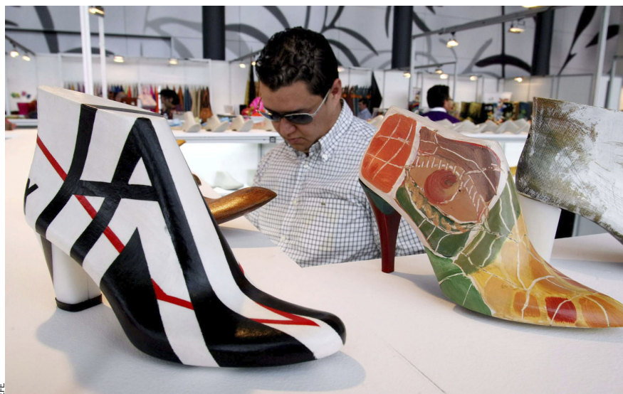
El calcer està molt concentrat a Elx, Elda i, a menys escala, a Villena, mentre que el joguet és a l'Alcoià i la Foia de Castalla; el torró, a Xixona, i el marbre, a les Valls del Vinalopó.

Mantenir una indústria potent, potser, hauria estat una via fonamental per a intentar resistir l'impacte de la crisi econòmica en millors condicions. Un assalariat dels sectors tradicionals de l'economia alacantina generava, al mateix temps, tres o quatre llocs de treball en les indústries auxiliars. Això, combinat amb l'exportació, podria haver atorgat un marge de confiança per a fer més suau la caiguda de la xifra de negoci. Però, a hores d'ara, l'escenari és molt diferent: l'aposta dels empresaris alacantins –la construcció– s'ha enfonsat, els sectors industrials tradicionals malviuen –més d'una quarta part del negoci treballa en l'economia submergida– i només el turisme, arran de l'empenta del mercat anglès i mirant ara cap a l'est d'Europa, albira el futur amb un cert optimisme. Hi ha alternatives per a tractar de superar la crisi i intentar capgirar aquestes dades negatives? S'han pres decisions polítiques per a generar condicions que afavorisquen que les empreses de la indústria tradicional mantinguen les seues línies de negoci a les nostres comarques? No hi ha, malauradament, una resposta clara. Al contrari, hi ha incertesa, deixadesa institucional d'un