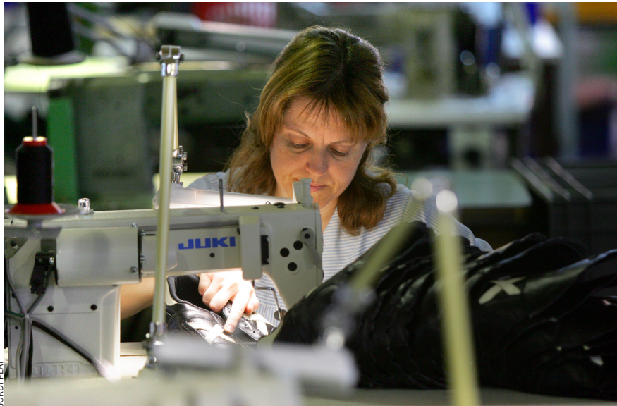
El calcer va intentar obrir-se a nous mercats i això l'ha salvat. Ara comença una relocalització .

que, alhora, continua reclamant –encara que la qüestió genera un fort debat amb els grups ecologistes– noves llicències per a obrir pedreres que puguen facilitar un increment de les extraccions. No sembla, però, que, en les circumstàncies actuals, unes tals autoritzacions puguen materialitzar-se.