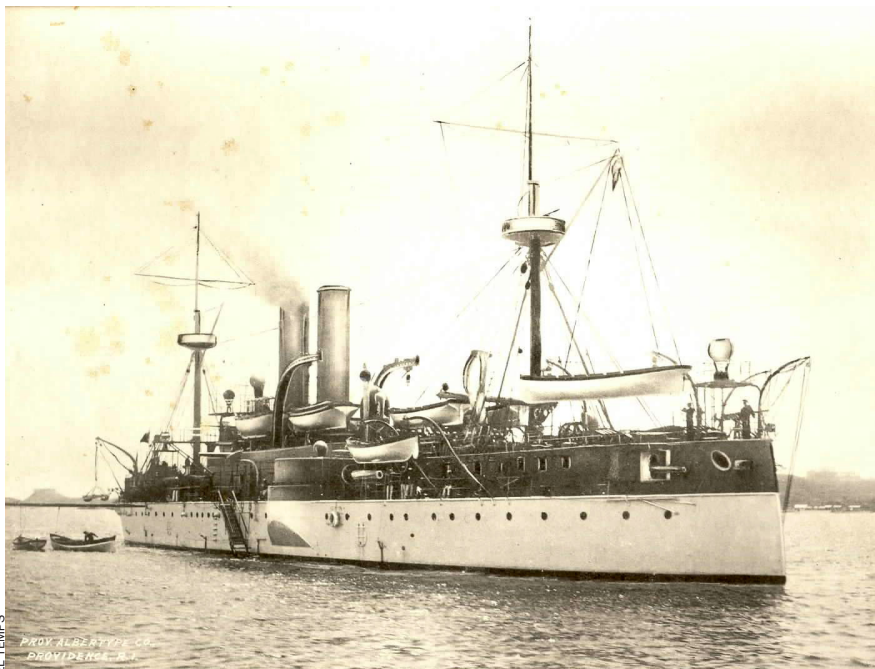
L'explosió del Maine a la badia de l'Havana va ser el detonant de la guerra amb els Estats Units.

Durant aquell mes de maig la guarnició de les Balears suma aviat 9.950 ho-