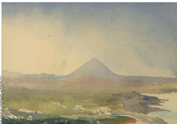
HEREUS FAMILIA LAMBERT