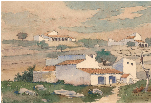
HEREUS FAMILIA LAMBERT