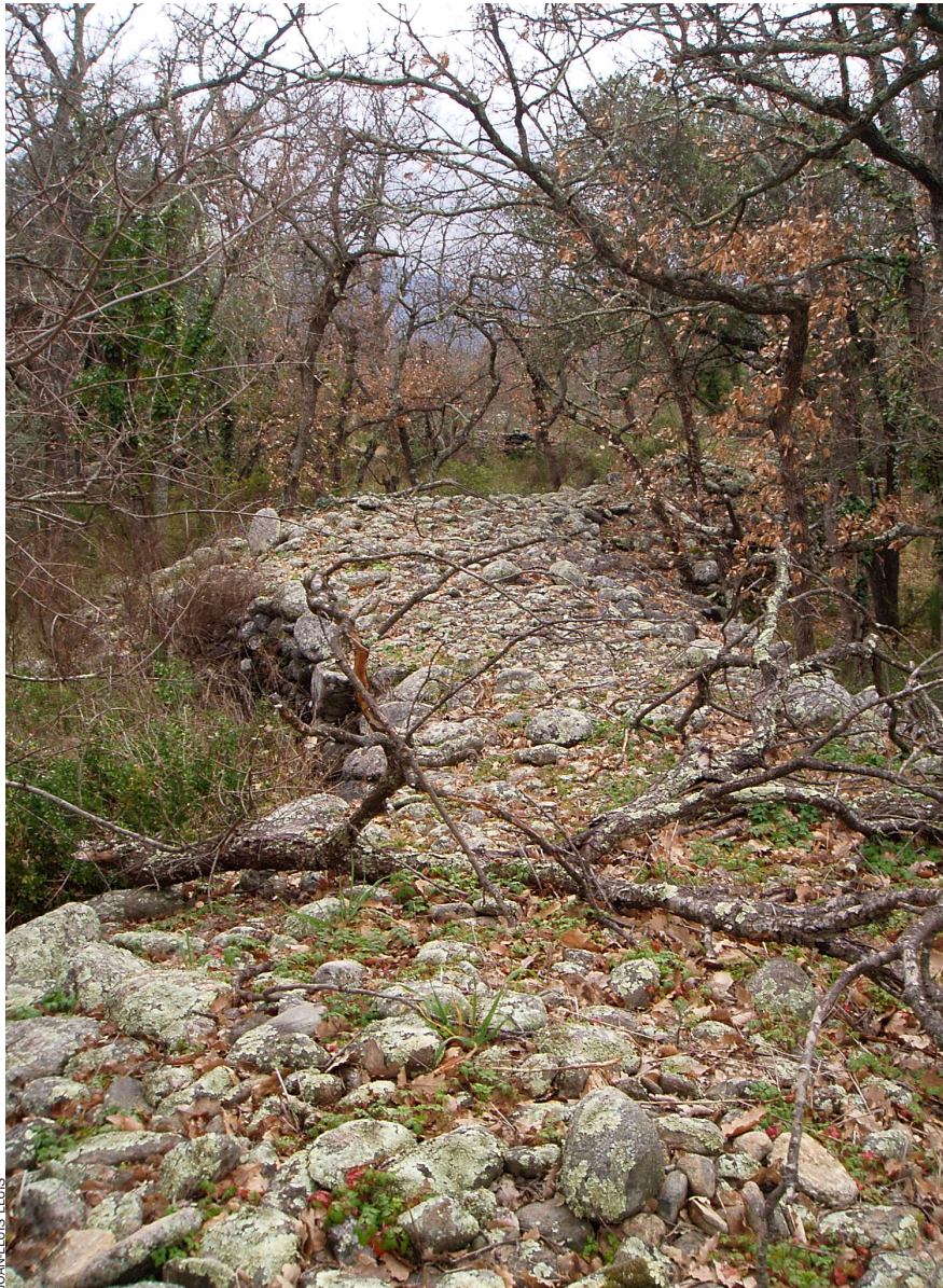
Sovint els Tarters fan dos metres d'amplada i semblen camins aixecats, pels quals dues persones es poden creuar còmodament.

modestos, que permeten endevinar que la mainada també hi treballava, i devia haver d'agrupar les pedres més petites per fer parets més baixes però també homogènies. En tot cas, si no se sap quan aquests camps van començar a ser abandonats, se sap amb certesa quan van ser abandonats: a l'hivern de 1956, dit l'any de la gelada. En pocs dies d'un fred inaudit arreu de Catalunya Nord van morir els olius, a vegades amb una detonació del tronc vençut pel gel que, diuen, feia plorar els pagesos i que va fer que durant gairebé mig segle l'oli d'oliva de fabricació local desaparegués pràcticament del tot.