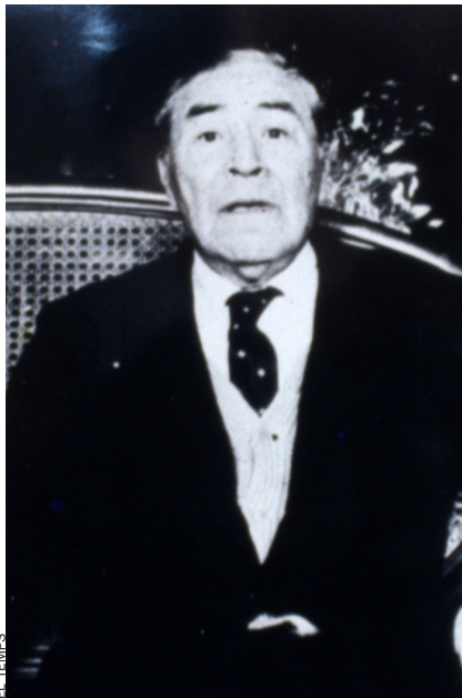
Josep Pla va debatre les idees de Charles Maurras, com una gran part dels més destacats escriptors catalans.