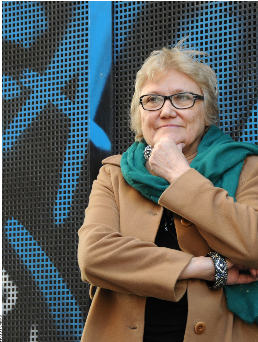
FRANCS I CAMPS