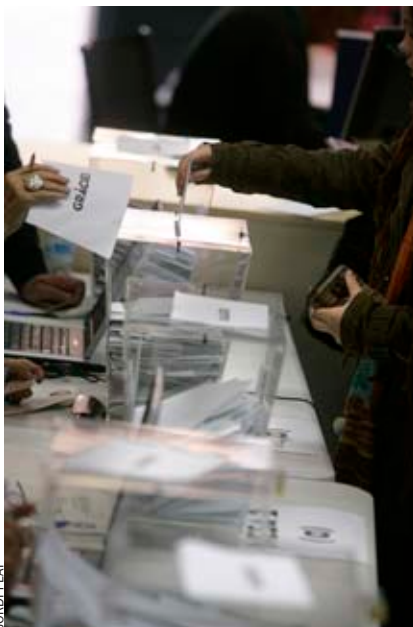
Un exemple de consulta popular fou la del 13-D de 2009.

reben fons públics que cobren sous excessius, així com la de certes prestacions vitalícies o suplementos retributius poc justificables. A més, cal fer públics els salaris de tots els càrrecs de lliure designació del govern i el patrimoni inicial i final dels càrrecs públics dels òrgans institucionals.