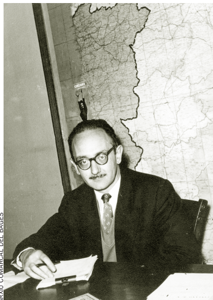
ARXIU COMARCAL DEL BAGES

Per tal d'assegurar la coneixença de l'escriptor, s'editarà una publicació divulgativa sobre la vida i l'obra d'Amat-Piniella, i se sol·licitarà a les llibreries, empreses editores i distribuïdores que mirin de garantir un accés