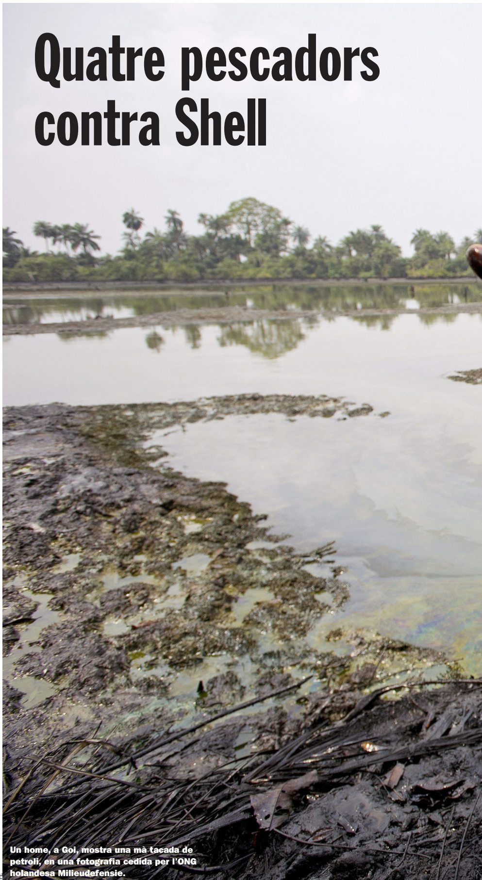
Un home, a Goi, mostra una mà tacada de petroli, en una fotografia cedida per l'ONG holandesa Milieudefensie.