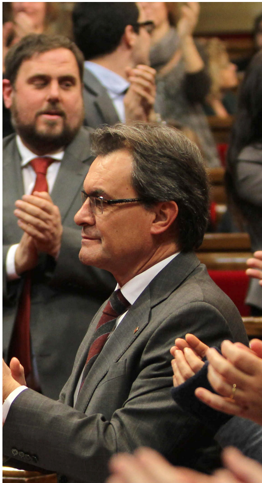
aprovada la resolució de sobirania.

Tot i que la resolució no té caràcter jurídic –es una mena de declaració política d'intencions–, Navarro va insistir que “no es pot apel·lar al principi democràtic sense legalitat” i que el model de resolució que presentaven CiU, ERC i ICV-EUiA “es carrega la possibilitat d'exercir el dret a decidir”. També va recordar que “l'article 1.2 de la Constitució diu que la sobirania nacional resideix en el poble espanyol del qual emanen els poders de l'estat, també els poders de la Generalitat”. I, si es vol canviar això, diu Navarro, cal canviar la Constitució i l'Estatut i cal un referèndum acordat en el marc de la legalitat. “No hi ha dreceres possibles”, conclou Navarro.