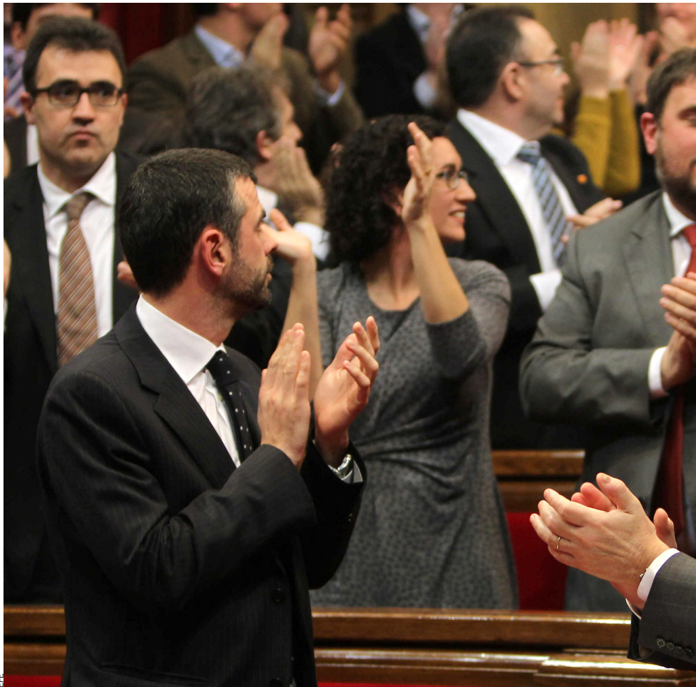
En primer terme, el president Artur Mas, i en segon terme Oriol Junqueras, després d’haver sortit

El primer secretari dels socialistes catalans va argumentar que la declaració de sobirania depassa els seus propis límits: “Que el Parlament de Catalunya declari