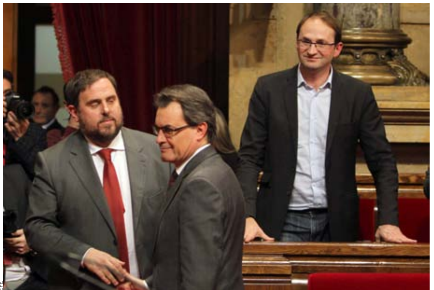
Oriol Junqueras, el president Artur Mas i Joan Herrera, una vegada aprovada la declaració per la consulta.

alternativament, que tampoc existirien si el govern espanyol, en lloc d'aplicar-nos un límit de dèficit del 0,7%, injust, inútil i ineficax, deixés que el relaxament de les condicions de dèficit que imposa la UE a l'estat també arribés a les comunitats autònomes, que són qui es fan càrrec dels serveis bàsics dels ciutadans, sanitat, educació i serveis socials. Tan sols fixant un dèficit del 2,1%, la Generalitat no hauria d'aplicar cap retallada.