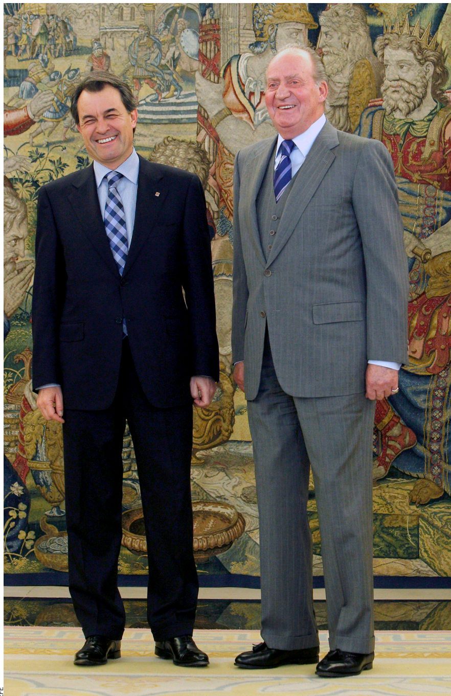
Ha creat molta expectació la pròxima reunió entre Joan Carles i Artur Mas, tot i que la Generalitat digui que es tracta d'una mera reunió protocol·lària.

El monarca espanyol adopta actituds contra el procés català que contrasten amb la neutralitat que havia mostrat anteriorment.