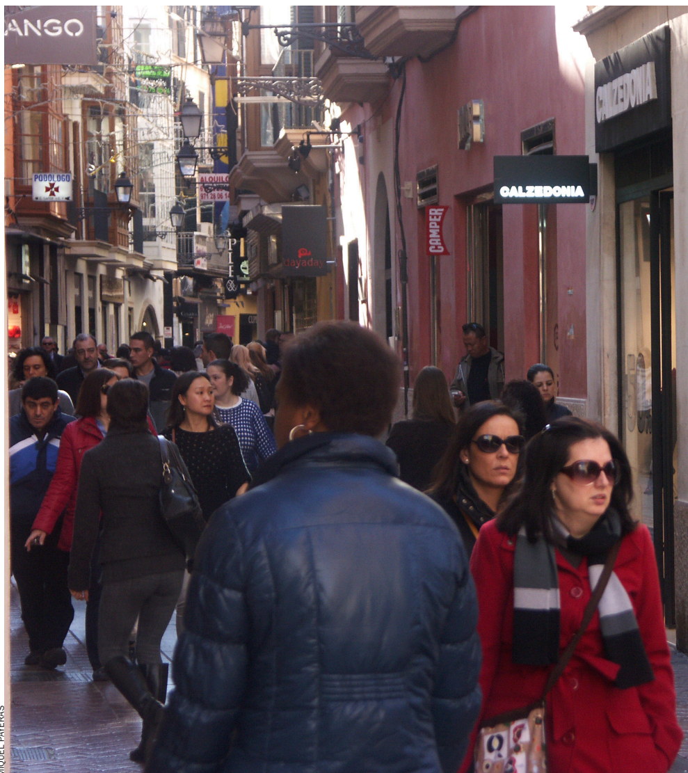
La població balear (en la foto, carrer comercial de Palma) és la que més ha crescut en la primera

Val a dir que està baixant la relació entre estrangers residents sobre el total