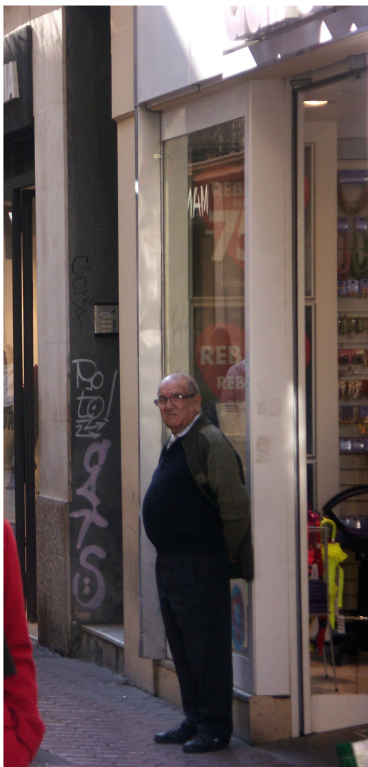
dècada del segle i mil·lenni.

El gran creixement demogràfic de Balears és degut fonamentalment a la immigració