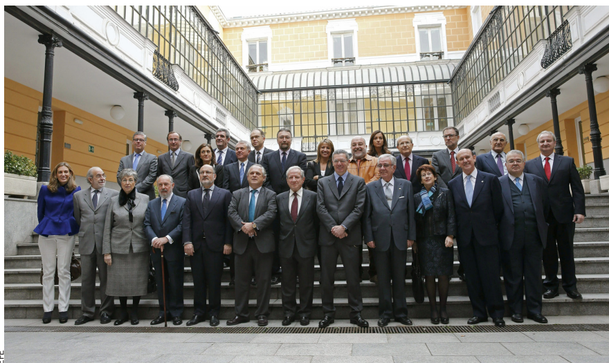
La llei de consultes arribarà al Tribunal Constitucional (TC) per una via o una altra. A dalt, la composició actual del TC amb el ministre de Justícia, Alberto Ruiz-Gallardón.