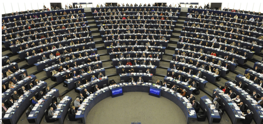
Les eleccions europees (a dalt, el Parlament) se celebraran a la primavera de 2014. Alguns defensen que la consulta hi coincideixi i d'altres que ho faci amb el referèndum d'Escòcia, a la tardor.

El Mundo advertia fa una setmana –en portada, el 2 de gener– que “Rotundes majories reclamen que l’estat actuï amb fermesa a Catalunya” i es fa ressò d’una enquesta –encarregada per El Mundo mateix a Sigma Dos– segons la qual el 71 per cent dels espanyols és partidari d’inhabilitar Artur Mas si “desobeeix una decisió del Tribunal Constitucional contrària a la consulta sobiranista”.