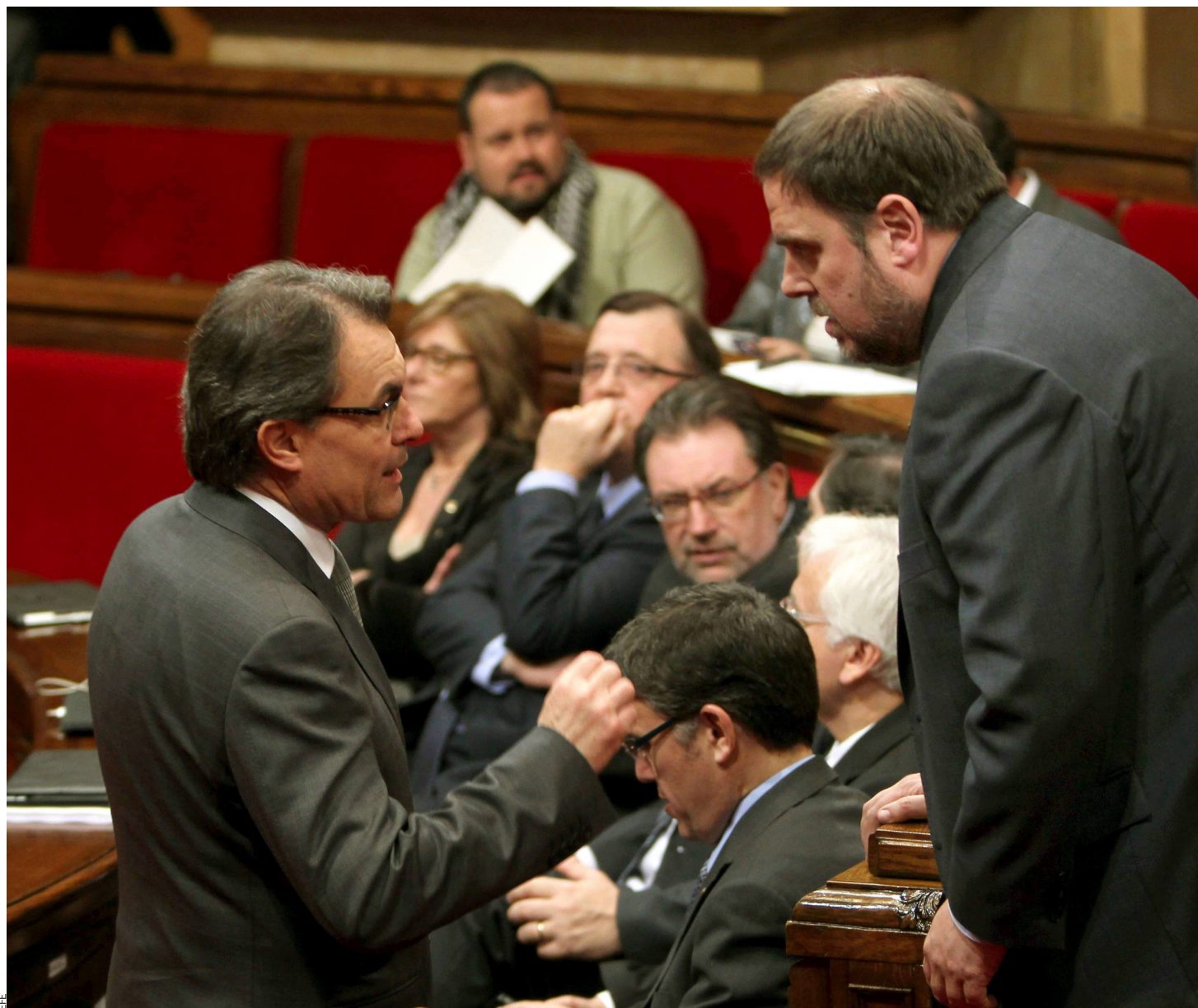
El president Artur Mas i Oriol Junqueras han signat un pacte d'estabilitat parlamentària que fixa la celebració de la consulta el 2014.