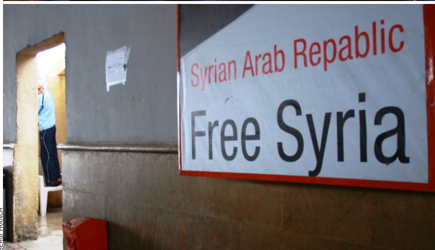
A dalt, tràfic de queviures i productes de primera necessitat al camp turc de Reyhanli. A sota, un pas fronterer entre Síria i Turquia controlat pels rebels.