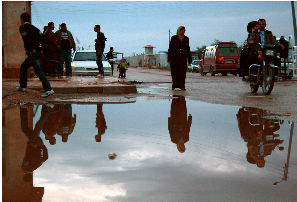
ment de refugiats de Reyhanli (Turquia) però està angoixada perquè els seus pares són a Alep (Síria).