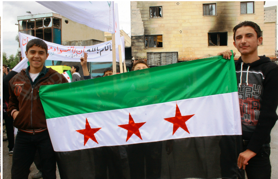
en poder dels rebels des del mes d'agost.