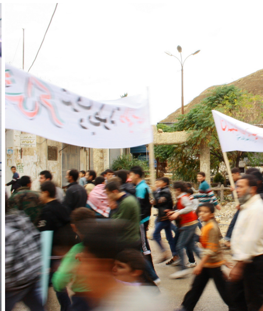
En Farouk atén un siria que acaba d'arribar a Reyhanli, a Turquia, fugint de Síria. A la dreta, dues imatges d'una manifestació a la ciutat siriana d'Azaz,

síries: s'hi fan convidades de té, la gent s'hi ajau a les estores i als matalassos i xerren amb intrascendència.