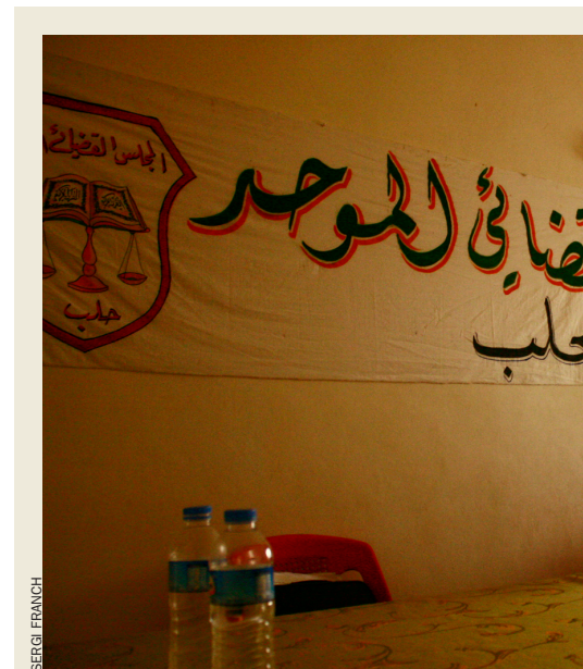
Els tribunals en camp rebel –en aquest cas

Les impressions de la gent que es troba fora i els qui viuen dins de Síria les separa, però, un abisme. Com a mostra, Azaz. Una ciutat del nord, sota el control dels rebels des del mes d'agost.