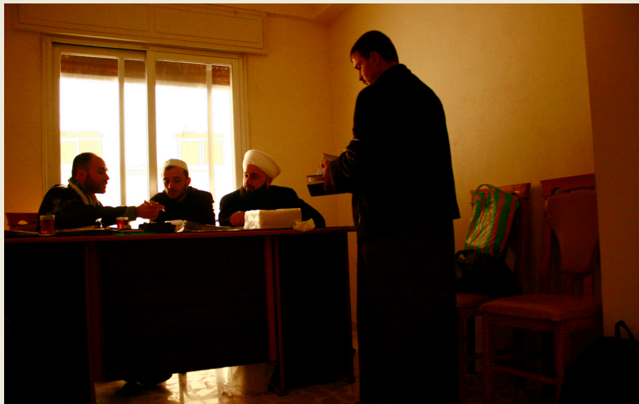
d'Alep- tot just comencen a organitzar-se. Estudien l'ingrés a l'exèrcit rebel de militars de l'exèrcit siria i casos de justícia ordinària.