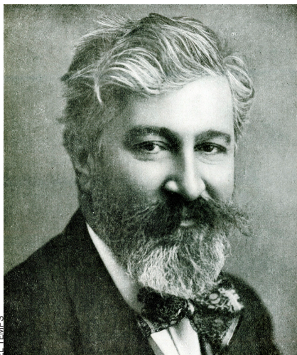
Santiago Rusiñol va enllestir l'obra de teatre Llibertat! , que es representarà al TNC, a València.

La tornada d'un indià procedent d'Amèrica al seu poble natal canviarà per sempre més les vides dels vilatans. Amb ell, arriba en Jaumet, un nen negre, que és adoptat per la població, en part com a mostra de la seva suposada