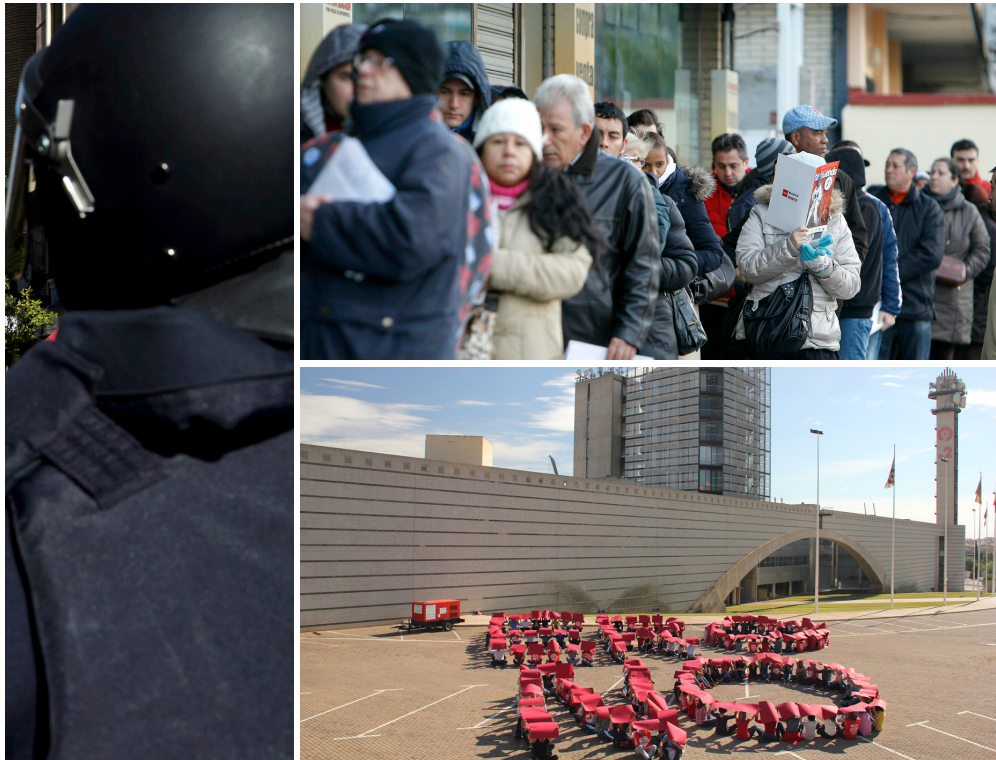
Dalt, a la dreta, una cua de gent aturada. Baix, protestes contra l'ERO de RTVV.