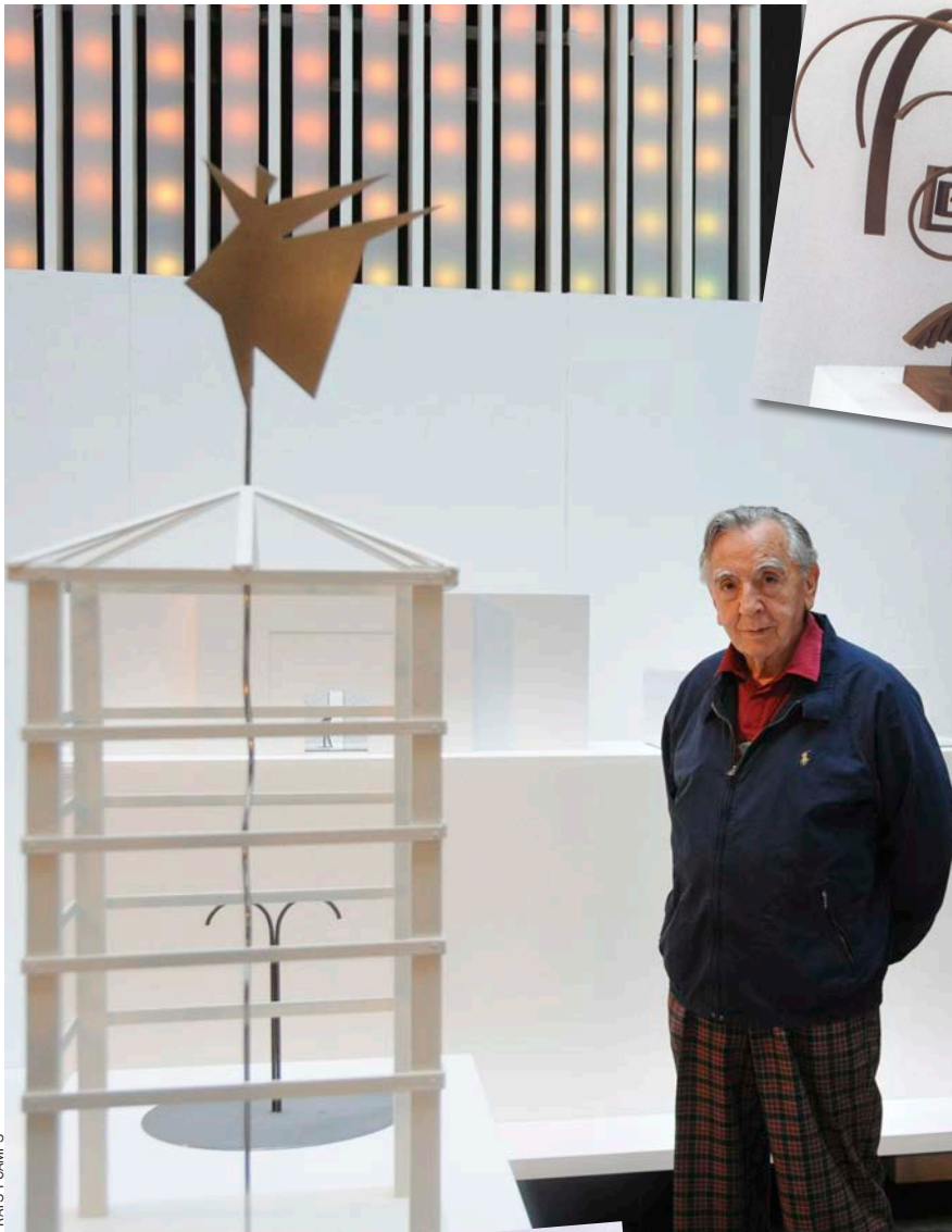
PRATS I CAMPS