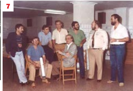
1. No fou fins els 40, que va optar per l'escultura. 2. A l'agència Publipress, va abocar-hi talent i va esdevenir-ne el líder. 3. Una de les campanyes que van idear, en què no dubtava aparèixer com a protagonista. 6. Investit Premi Nacional de les Arts, conversa amb el ministre Javier Solana. 7. Amb Climent,

La seua pertinença va permetre a Alfaro d'exposar més enllà del País Valencià. Va estrènyer lligams amb artistes catalans, sobretot a partir de la mostra conjunta que la sala Gaspar va dedicar al Grup Parpalló. De la mateixa manera, va conèixer l'escultor basc Jorge Oteiza, amb qui mantindria una bona i duradora amistat, fins al punt que se'n va sentir alumne. Comptat i debatut, l'eclosió definitiva d'Alfaro coincidia amb l'elecció de l'escultura com a nou mitjà d'expressió. Pertot s'intitulava escultor, convençut com estava que era aquest el rumb que volia prendre. El 1959, la seua obra va trencar les fronteres –les europees incloses– i va arribar fins a Alexandria.