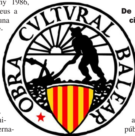
Durant mig segle l'Obra Cultural Balear, fundada, entre d'altres, pel filòleg menorquí Francesc de Borja Moll, no ha defallit mai en la lluita per la normalització de la llengua i cultura pròpies.

representats al Parlament de les Illes —AP, UM, PSOE i PSM— aprovin per unanimitat la llei de Normalització Lingüística (1986). El consens lingüístic que tant ajudà a crear l'Obra s'ha mantingut viu fins enguany, quan el govern de José Ramón Bauzá l'ha trencat.