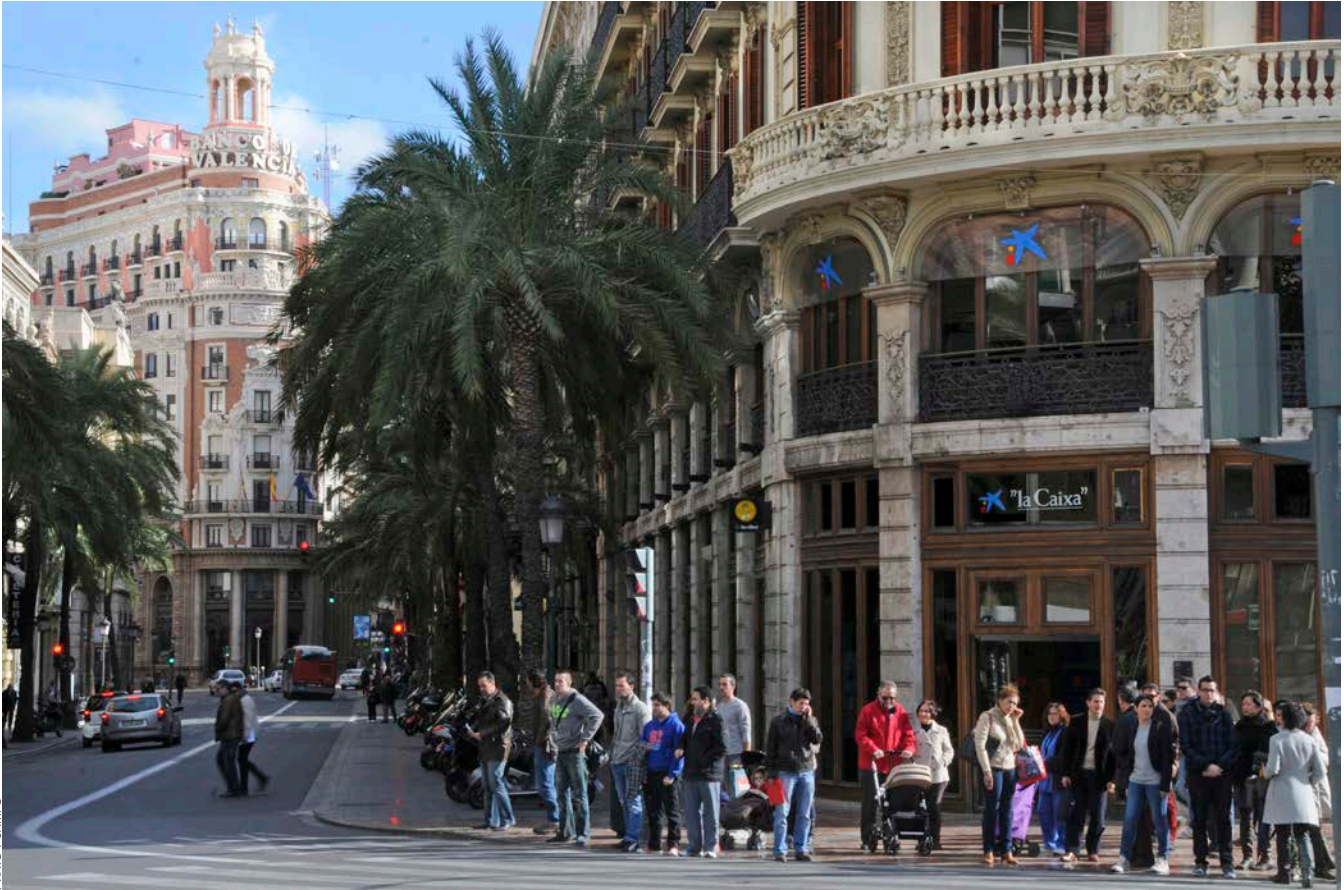
PRATS I CAMPS