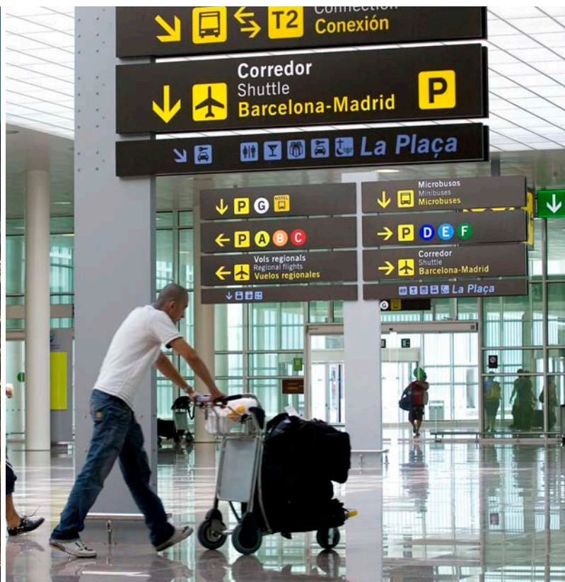
cions, a Barcelona. Un nou estat s'ha de dotar d'institucions com aquesta, a més d'ens gestors dels aeroports i ports.