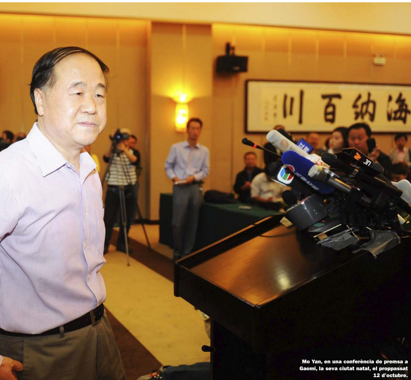
Mo Yan, en una conferència de premsa a Gaomi, la seva ciutat natal, el propassat 12 d'octubre.

contraccions. Mai no havia llegit res tan dur en cap obra literària. Comparada amb això, la història de Medea és tot flors i violes. La dona està en conflicte amb tots els poders, fins i tot amb la seva pròpia família. El seu estimat mor d'un tret de la policia a l'esquena. Troba la seva fi en una biga després de totes aquestes experiències d'intimitat i brutalitat. I la poesia, i fins i tot els elements còmics de la novel·la no atenuen gens aquest moment dur i despietat. Cada detall és bell i horripilant alhora. Es pot llegir del tot per la bellesa. De vegades em