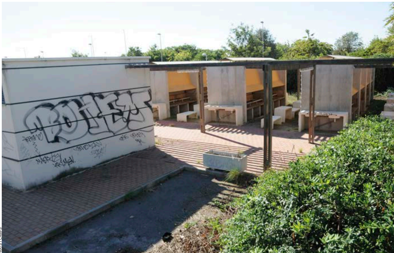
Instal·lacions de l'Institut de la Paella, abandonades des d'abril de 2007.